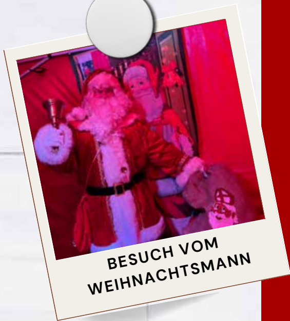
BESUCH VOM WEIHNACHTSMANN

FEUERWEHR SNOWBOARD-SIMULATOR WICHELGLÜCKSRAD ELEKTROLOKOMOTIVE VERKAUFSSTÄNDE SPEISEN UND GETRÄNKE