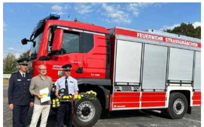
Fahrzeugübergabe bei der Ortsfeuerwehr Straßgräbchen