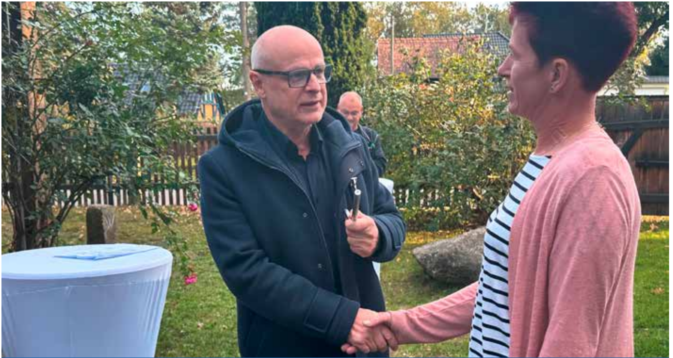
Übergabe des Dorfmuseums Zeiðholz