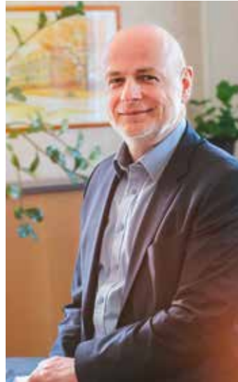
Liebe Bernsdorferinnen und Bernsdorfer, liebe Leserinnen und Leser,