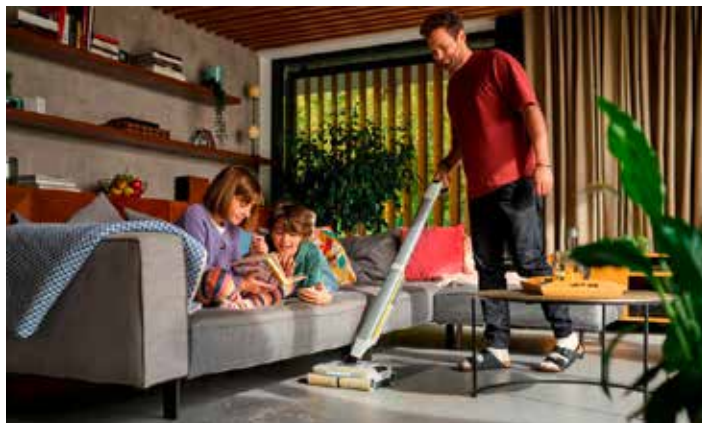
So wird's blitzsauber: Für das richtige Putzen sind die Ratschläge der Mütter weiter stark gefragt. Aber auch in den sozialen Medien finden viele nützliche Tipps.

Wer hat sich nicht schon einmal geärgert, wenn auf den Fliesen nach dem Wischen Putzstreifen sichtbar sind – oder wenn die Sonne ärgerliche Schlieren auf den gerade erst gesäuberten Fenstern zum Vorschein bringt. Keine Frage, auch das richtige Putzen will gelernt sein. Doch wo findet man die besten Tipps für das effektive Sauberhalten der eigenen vier Wände? Vorbilder sind gefragt. Und da steht für viele die eigene Mutter unangefochten an Platz Nummer eins. Dieses Ergebnis fördert die aktuelle Putzstudie zutage, die Dynata im Auftrag von Kärcher in Deutschland und neun weiteren Ländern mit Personen im Alter zwischen 18 und 65 Jahren durchgeführt hat.