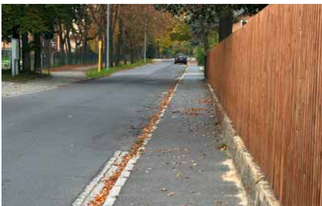
Alte Schulstraße erhält grundhaften Ausbau