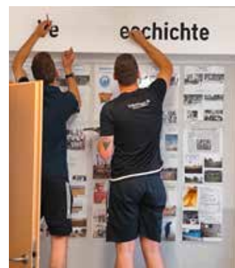
Fingerfertigkeit war bei der Gestaltung der Wand „Vereinsgeschichte“ gefragt.