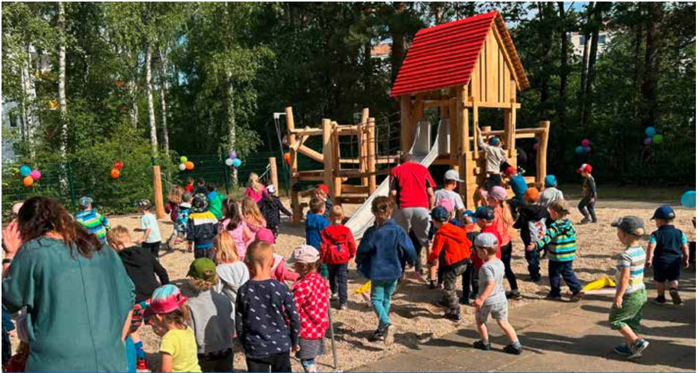
Neues Spielgerät für die Pfiffikusse

Amts- & Mitteilungsblatt der Stadt Bernsdorf mit den Ortsteilen Großgrabe, Straßgräbchen, Wiednitz, Zeißholz 31.08.2024