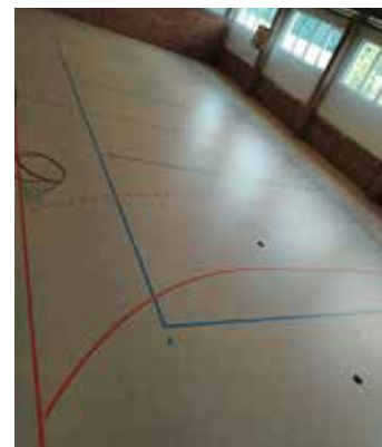
Ein „heimlicher“ Blick Anfang August zum Stand der Arbeiten in die Sporthalle Straßgräbchen

Jetzt schon ein Dankeschön an die Stadtverwaltung Bernsdorf, die mit Hilfe von Fördermitteln und mit Mitteln aus dem eigenen Haushalt die Sanierung der Halle möglich gemacht hat.