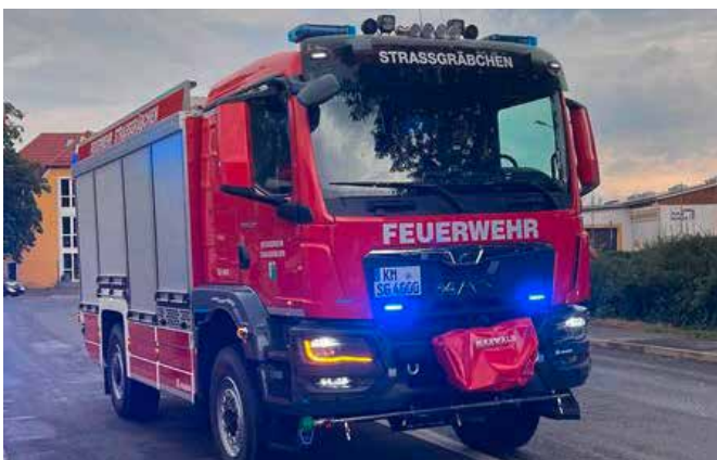
Neues TLF 4000 in Empfang genommen