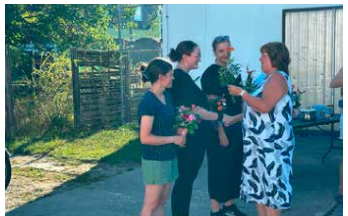
Begrüßung der erfolgreichen Kunstradfahrerinnen in Wiednitz