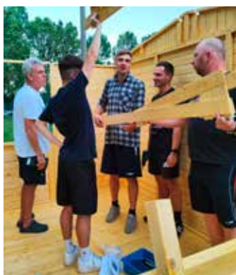
Mit Köpfchen und Muskelkraft war die Verkaufsbude schnell montiert.

Die Sommermonate wurden von Fußballern des Vereins genutzt, um die Gestaltungsarbeiten im Sozialgebäude weiterzuführen. So wurde eine Wand gestaltet, die auf die Vereinsgeschichte verweist. Zur Verbesserung der Imbissversorgung auf dem Sportplatzgelände wurde eine durch den Verein angeschaffte neue Verkaufsbude in ehrenamtlicher Arbeit von Fußballern und weiteren Helfern aufgestellt. Zur Verbesserung der Information und Kommunikation wurden an der Stirnseite des Sozialgebäudes Informationstafeln angebracht.